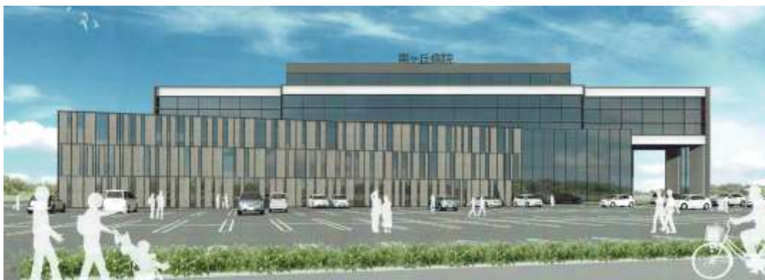
新病院完成予想図

今後約2年をかけて移転事業を進めて参りますが、この「みなみかぜ」等の紙面なども利用し皆様に進捗状況をお伝えしていきたいと思っております。どうぞ今後とも宜しくお願い致します。